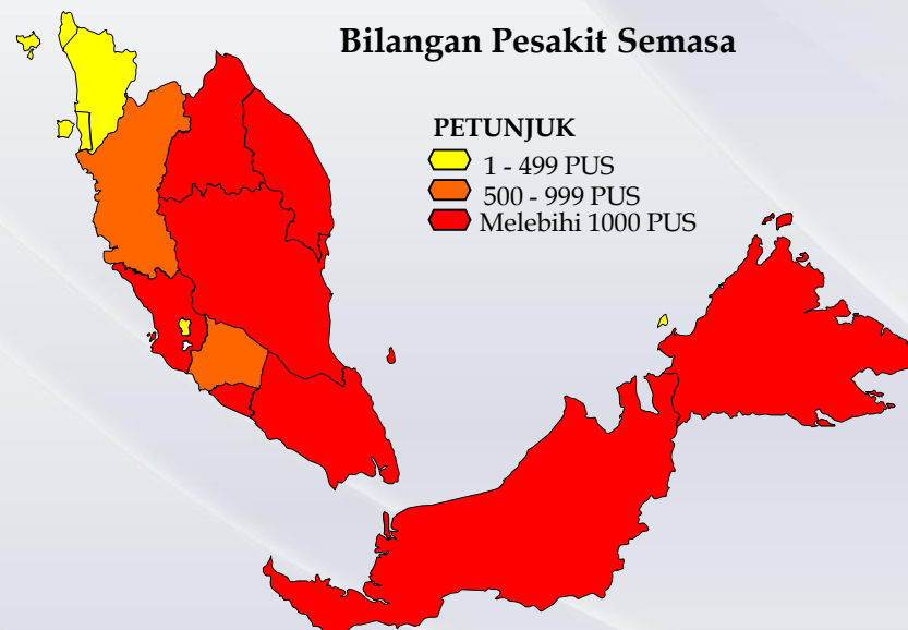
Bilangan Pesakit Semasa