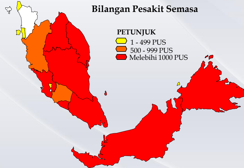
Bilangan Pesakit Semasa