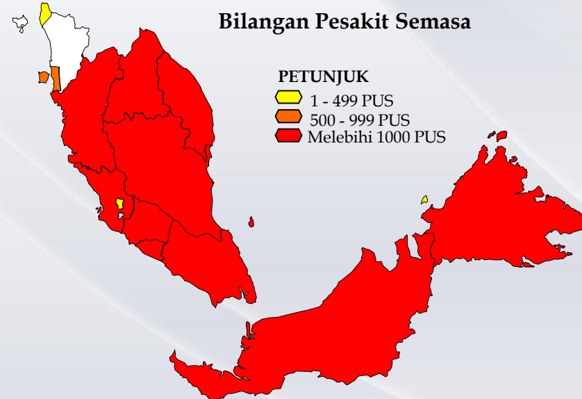
Bilangan Pesakit Semasa